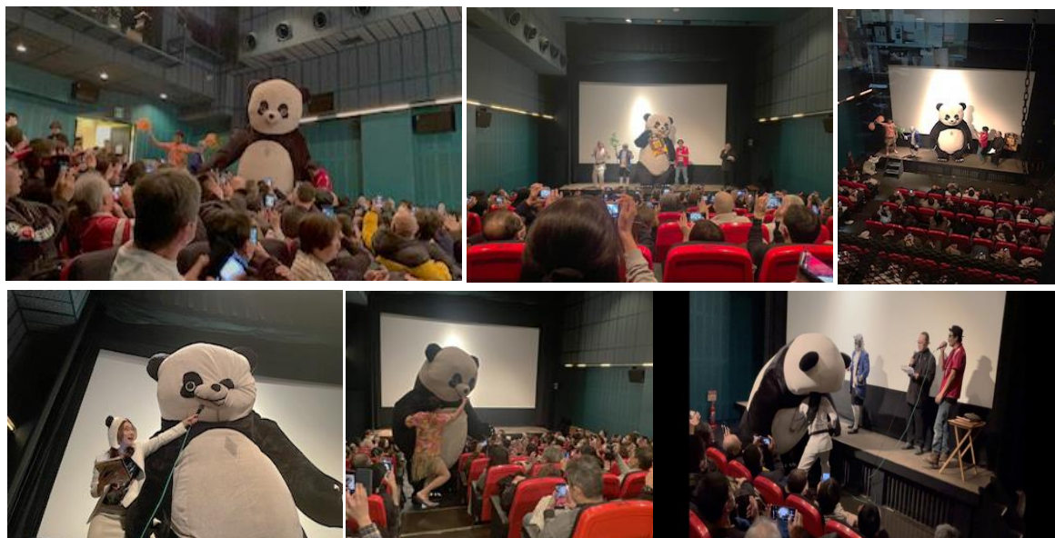
オッサンタイガー、アンドレザ・ジャイアントパンダ、M.C.マーシーによる舞台挨拶