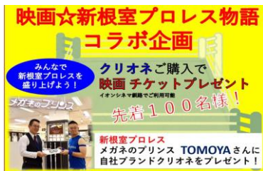
新根室プロレス公式SNSで告知

眼鏡販売の道内大手メガネのプリンスは2023年12月17日～釧路イオン店を皮切りに、釧路春採店、中標津店、北見イオン店、北見三輪店、小樽イオン店でコラボ企画を開催しました。