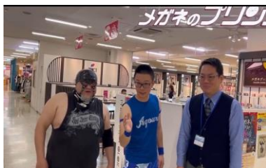
新根室プロレス公式YouTube