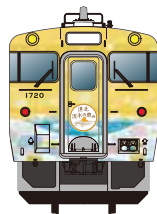
キハ40形「北海道の恵み」シリーズ車両 『道北 流水の恵み』