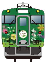
キハ40形「北海道の恵み」シリーズ車両 『道東 森の恵み』