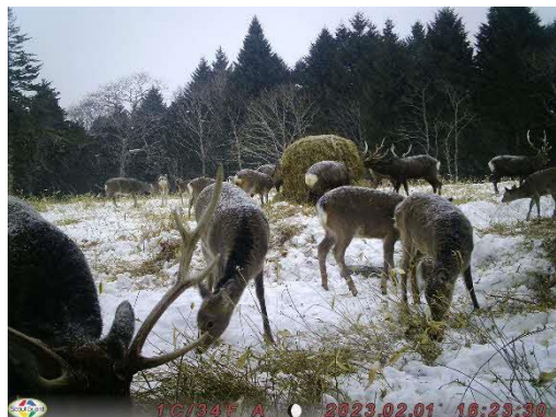
・ 令和 4 年度調査実施状況