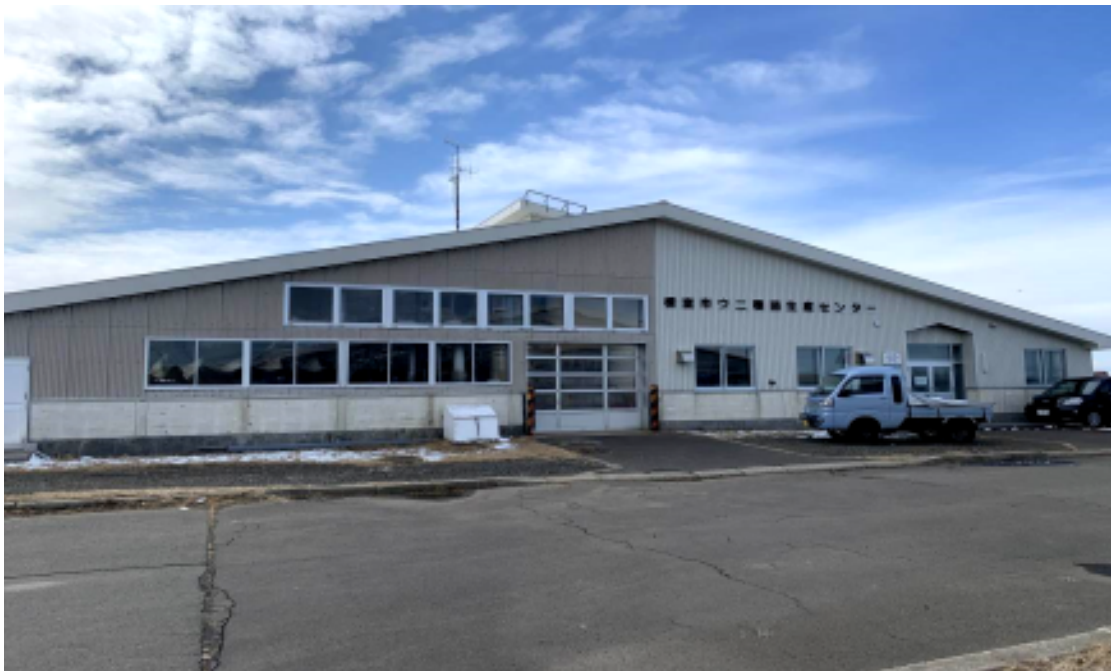
根室市ウニ種苗生産センター外観