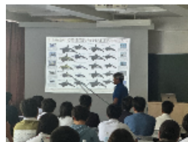
大学体験【海洋学部】