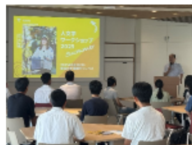
大学体験【人文学部】