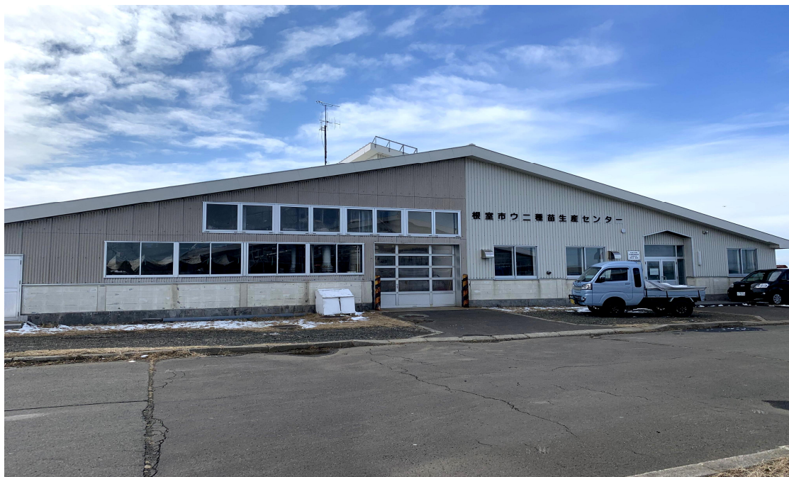
根室市ウニ種苗生産センター外観