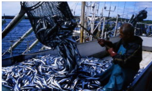
■9月に最盛期を迎える「さんま漁」