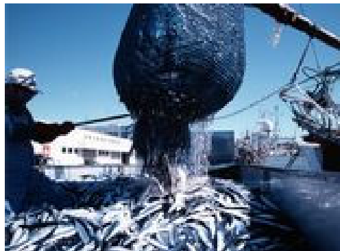
【日本一の水揚げを誇るさんま漁】