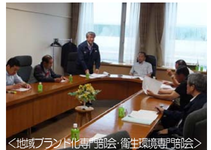
＜地域ブランド化専門部会・衛生環境専門部会＞