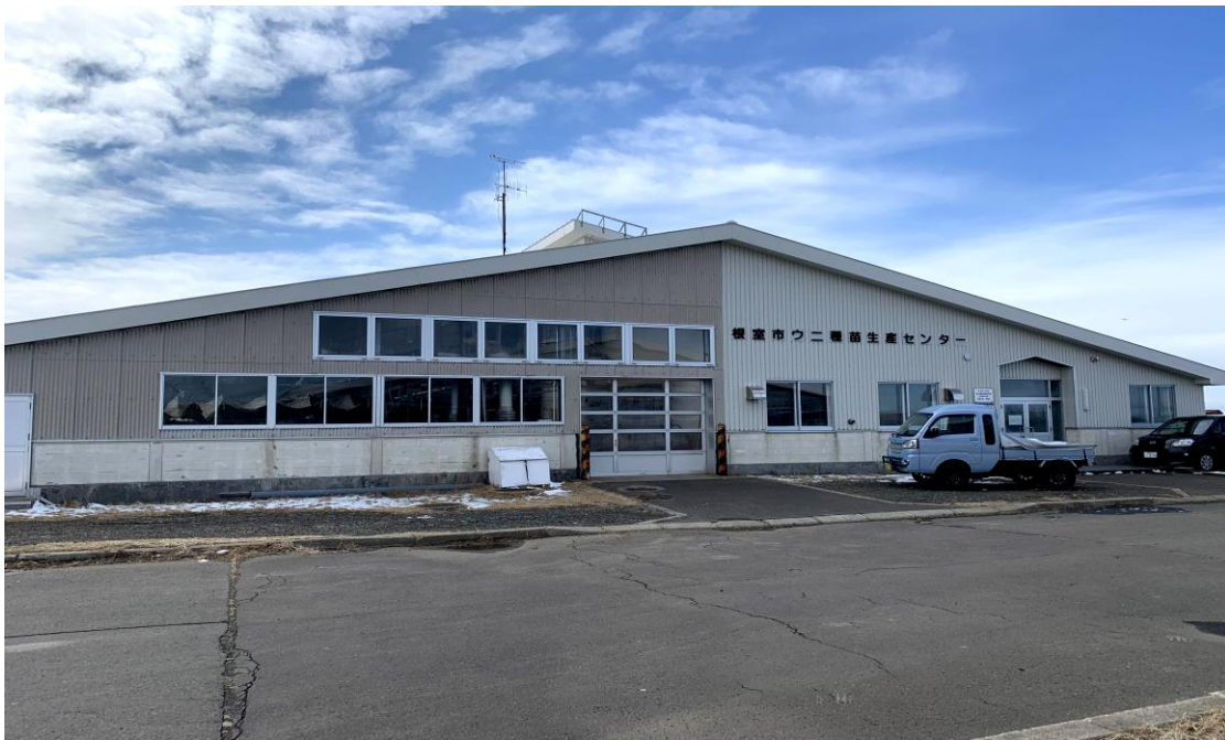
根室市ウニ種苗生産センター外観