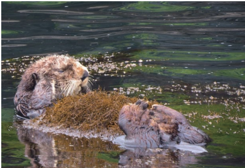
(写真) ホンダワラをお腹に巻きつけて眠るラッコ

また、ラッコや海鳥の巡視、観察を行っている、鳥獣保護員さんにも話を聞いたところ、ホンダワラの仲間以外にもスガモという、アマモの仲間の海藻を体に巻き付け、眠っているのも観察しているとのこと。お腹の上にブランケットをかけ