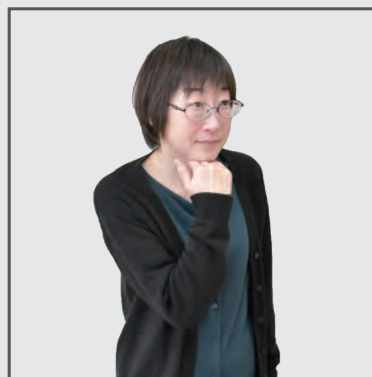
右手の親指以外4指の背をあご の下にあてる

「お待ちください」を意味する手話は右手 4指の背をあごの下にあてることで表現 します。この動きはあごの下にあるまっ すぐに伸ばした腕で「首を長くして待つ」 という意味を伝えています。