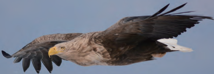
空を飛ぶオジロワシ

私 は、今年で根室市へ来て5年になりますが、住んでいる間に様々な野鳥と出会えました。その中でも最も印象的だったのはオジロワシです。引っ越してきた日、自宅の上空を1羽のオジロワシが旋回しながら飛んでいる姿が見られました。その光景にとっても感動しました。