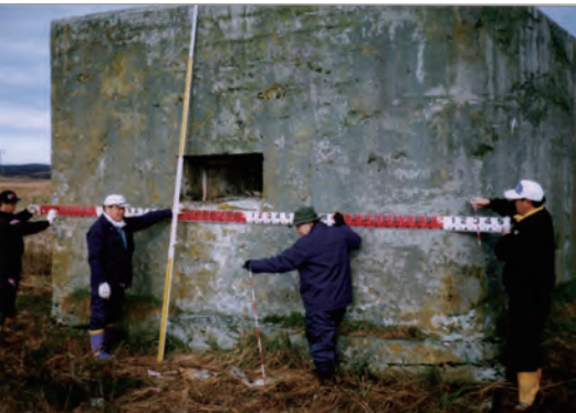
(写真2)市民団体による調査の様子(平成10年頃)

を構えるための小さな窓が備えられています。おもに昭和19年に作られたもので、太平洋岸に面した海岸に13カ所現存しています。太平洋戦争末期にアメリカをはじめとする連合国軍の陸に備えるものとして旧陸軍によつて作られました。根室市街地を守るための防衛線上にトーチカは設置され、塹壕などとともに防衛陣地が構築されました。こうした一連の陣地構築を指揮した人物が、陸軍少佐として