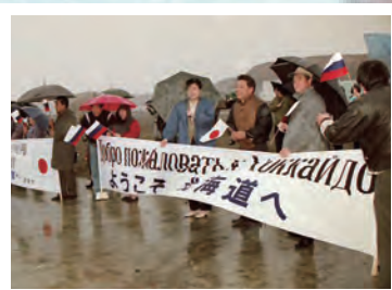
平成4年 初の日ロビザなし交流受け入れ