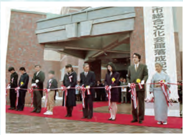
平成5年 総合文化会館落成記念式