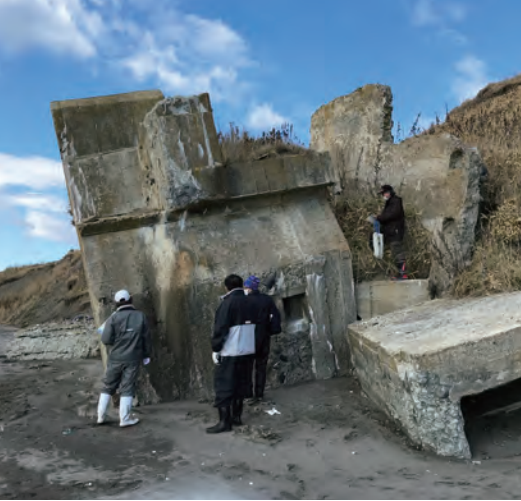
(写真1)落石トーチカ調査の様子(令和2年11月)

トーチカはロシア語で「点」という意味で、コンクリート製の箱型をしており、出入口と銃