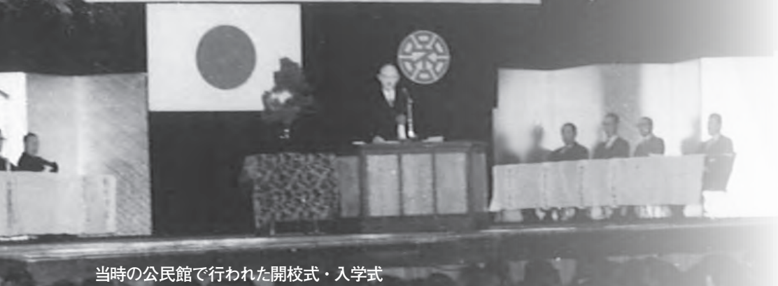
当時の公民館で行われた開校式・入学式