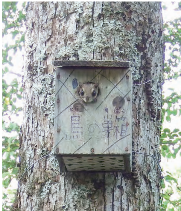
巣箱を利用したモモンガ (2016年)

今回モモンガの姿は、残念ながら見られませんが、この林内で暮らしている痕跡はしっかり確認することができました。2か所で木の根元に、米粒より一回り大きなフンがごっそり落ちていたのです。冬の間は、暖を保つのに5～6匹が同じ巣穴で生活するそうなので、複数のモモンガのフンなのかもしれません。昨秋ネイチャーセ