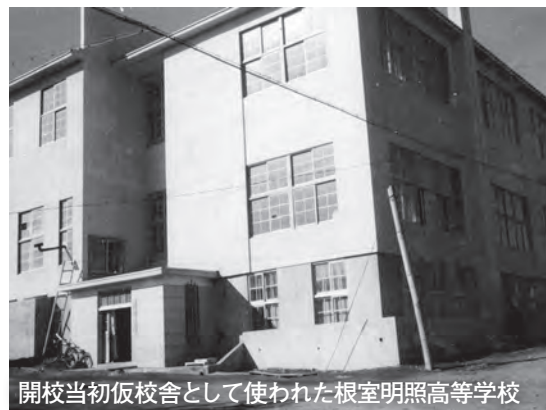
開校当初仮校舎として使われた根室明照高等学校

根室西高等学校は昭和45年、私立根室明照高等学校の閉校に伴い、高等教育の場を確保するという市の方針のもと、市立高校として誕生しました。