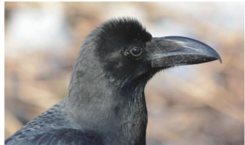
(写真1) ハシブトガラスはくちばしが大きくて湾曲している

ところで昨冬、根室では、高病原性鳥インフルエンザで多くのハシブトガラスが命を落とすという事件がありました。この病気は、ニワトリなどの家禽の間で進化したと考えられていて、ニワトリだけでなく野鳥を殺すこともあります。春にはおさまっていたのが、冬の訪れとともに各地で病気がまた見つかり、心配しています。カラスがかわいくて餌をやっておられる方を見かけることがありますが、そういう餌場でウイルスが広まってしまう可能性もありますので、カラスのためにも餌やりは自重していただけるとありがたいです。