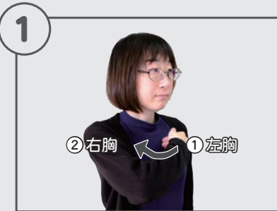
軽く曲げた右手の指先を左胸、 右胸の順にあてます。