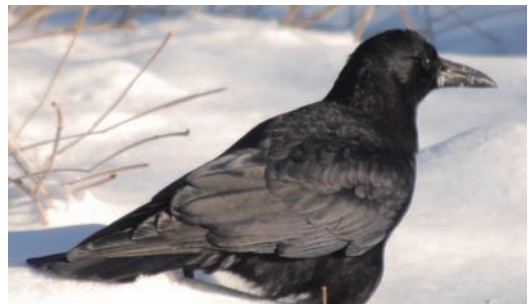
(写真2) ハシボソガラスはくちばしがなだらか

☞ 根室市春国岱原生野鳥公園ネイチャーセンターTEL (25) 3047 番 記事：レンジャー 古南幸弘 (公財)日本野鳥の会所属