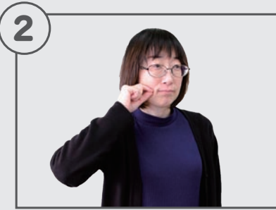
2指(人差し指と親指)をくっ つけて頬につける。

※定員に達し次第締切らせてい ただきます。 選考場所 北海道障害者職業能 力開発校 試験内容 学力試験(国語・数