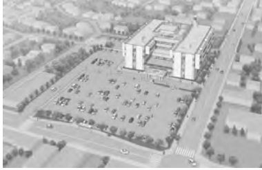
新病院完成予定図