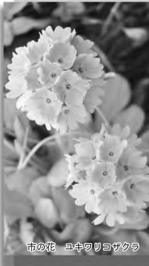
市の花 ユキワリヨザクラ

北陸新幹線の富山県開業を記念した黒部市でのイベントで北国讃歌の合唱を行なう参加者を募集