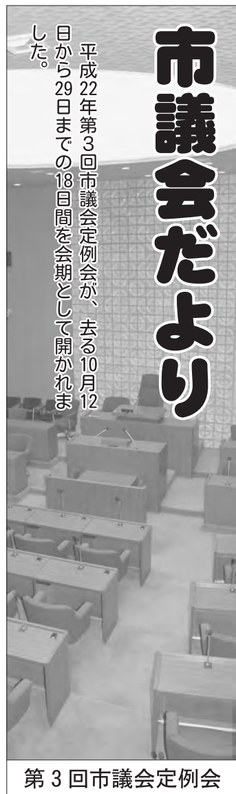
第3回市議会定例会