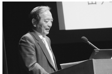
根室港発展へのアドバイスを送る長野教授