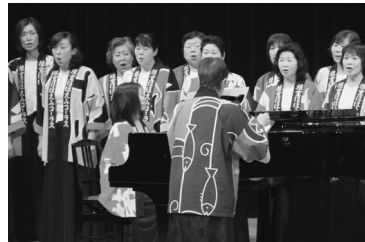
美しい歌声を披露した「ほほえみコーラス」