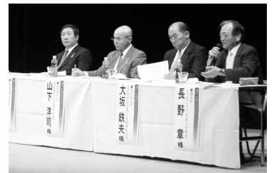
根室港について熱く語り合うパネラー

災害発生・被害の恐れのある場合や、普段の生活で不安に思うことなどの相談を24時間受け付けます。