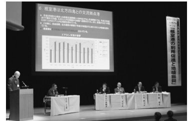
さまざまな未来展望が出されたパネルディスカッション