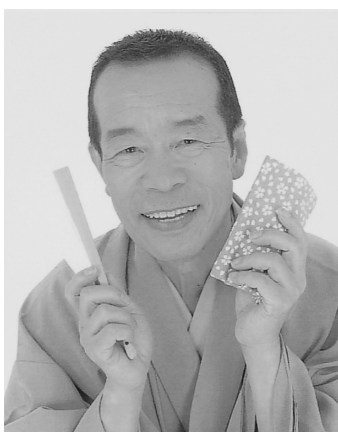
アトラクションを飾る「笑点」でおなじみの林家木久蔵師匠