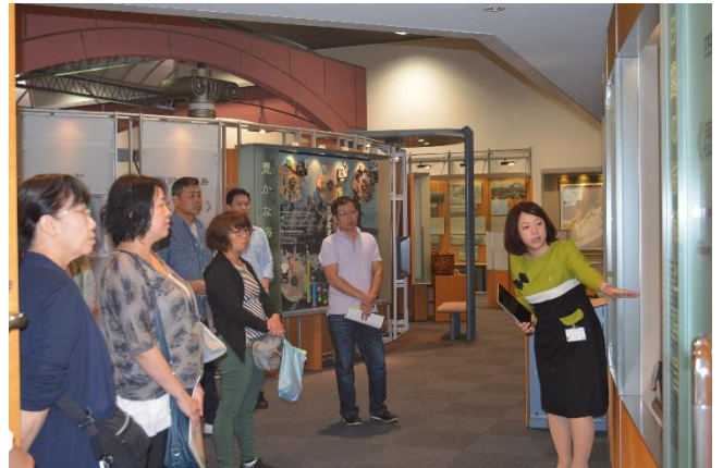
日本労働組合総連合会