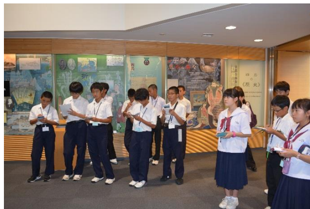
山口県青少年現地視察団

～都道府県青少年現地視察団とは～ 全国の青少年等に北方領土問題を身近に捉えてもらい、また、返還運動の継承を目的として、北方領土返還要求運動都道府県民会議が主体となって実施されている事業です。