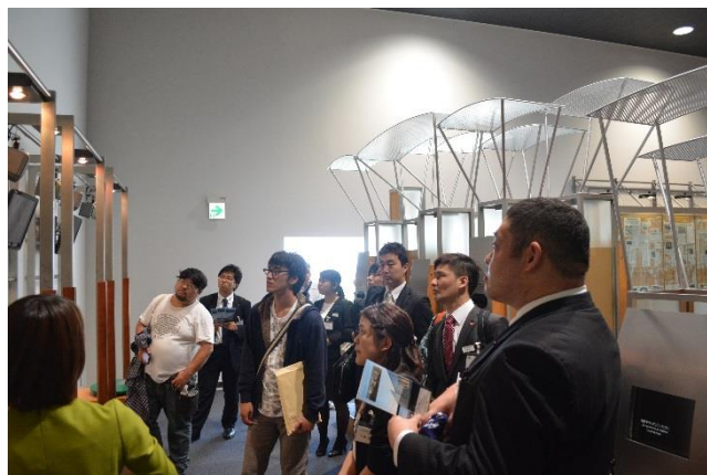
日本青年団協議会