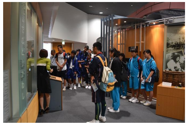
高知県青少年現地視察団