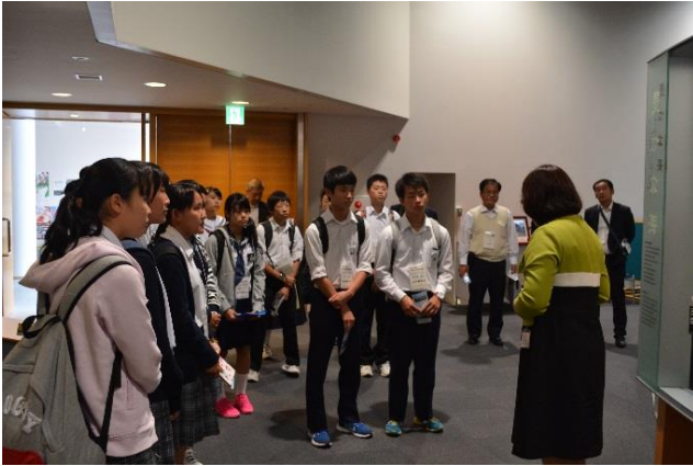
宮城県青少年現地視察団