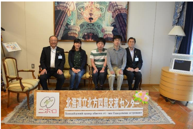
早稲田大学法学部水島ゼミナール