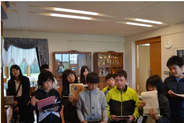
厚岸町立太田・高知小学校