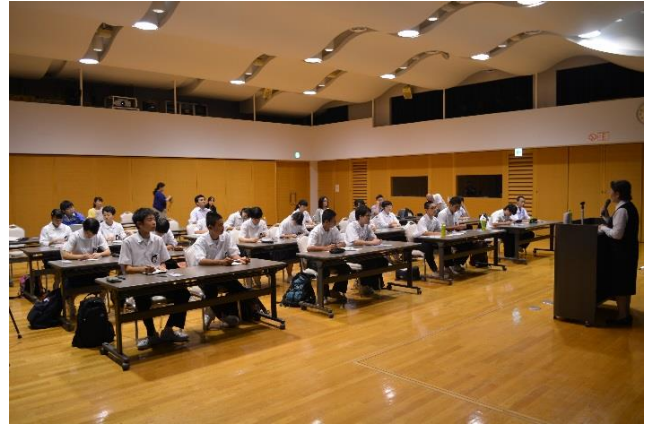
岐阜県青少年現地視察団