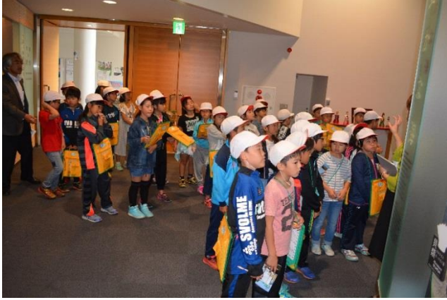
根室市立成央小学校