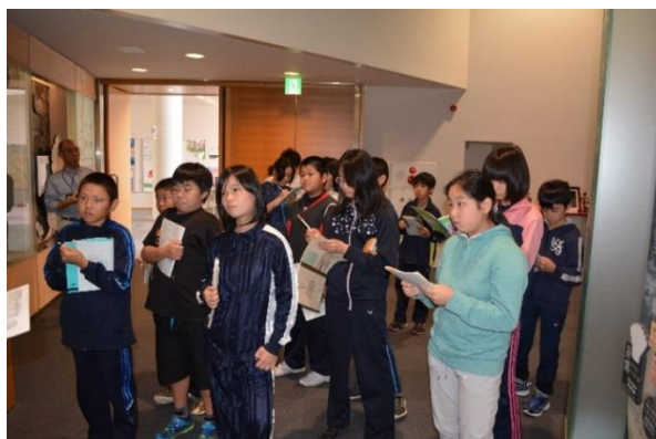
中標津町立計根別学園