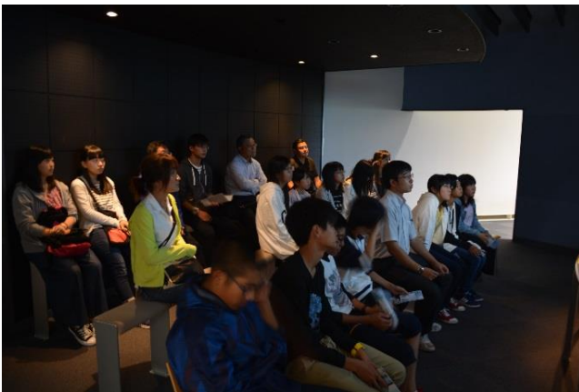
山梨県青少年現地視察団