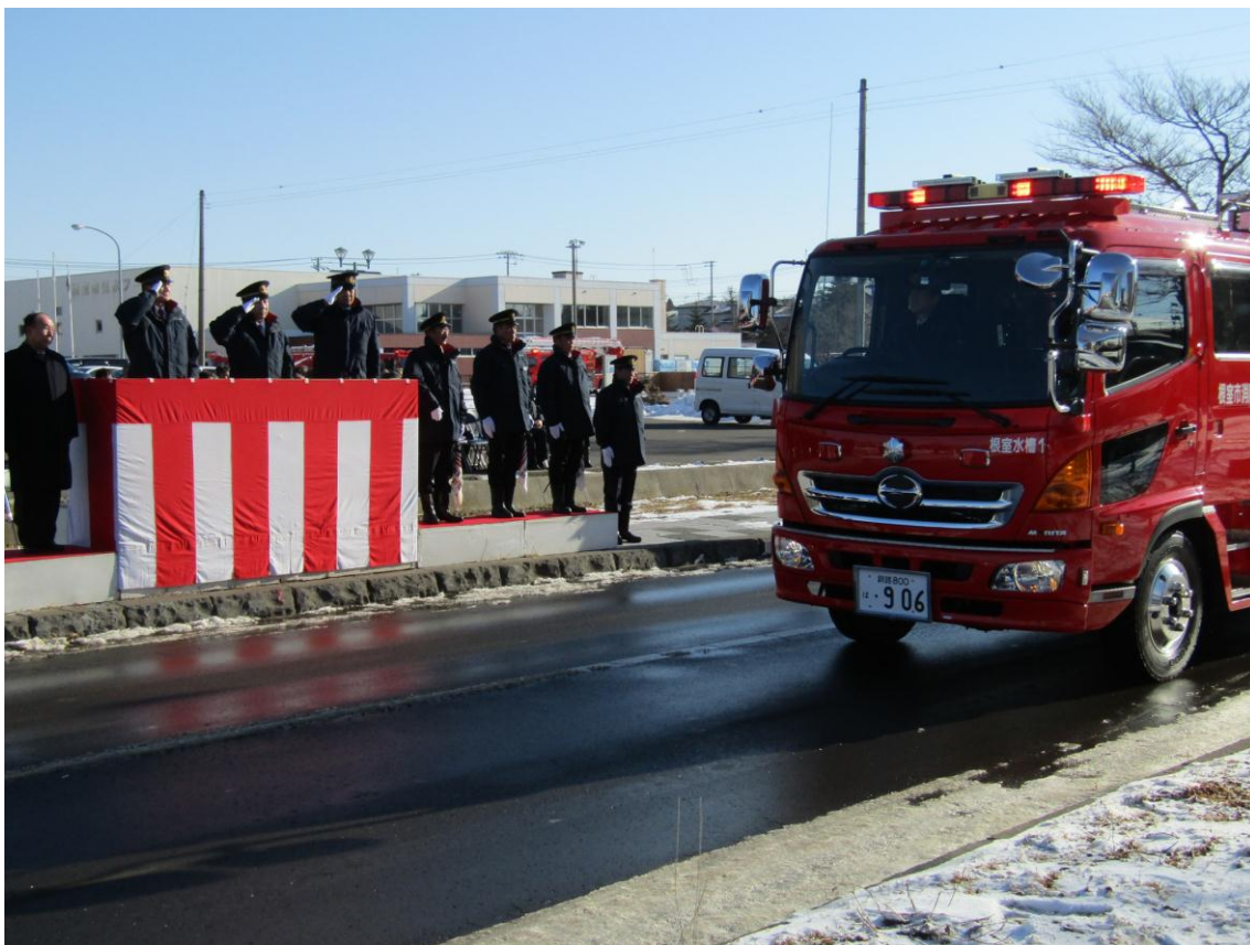
消防出初式 (水槽付消防ポンプ自動車 分列行進)