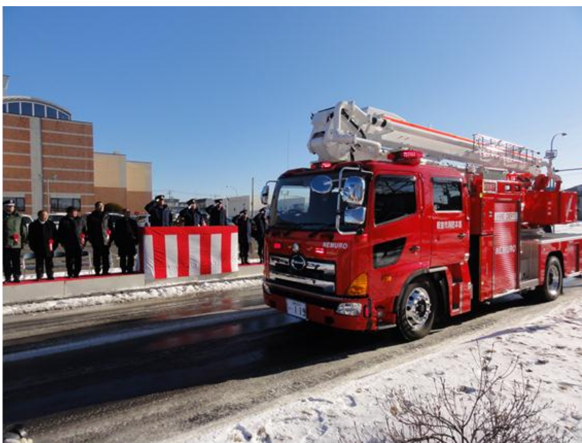
消防出初式 (はしご車 分列行進の様子)