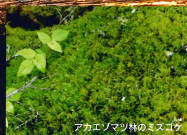
アカエゾマツ林のミズゴケ