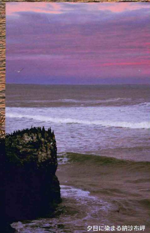
夕日に染まる納沙布岬

Колонии шиповников и елей глена на дюнах всё это необыкновенное чудо создала сама природа.