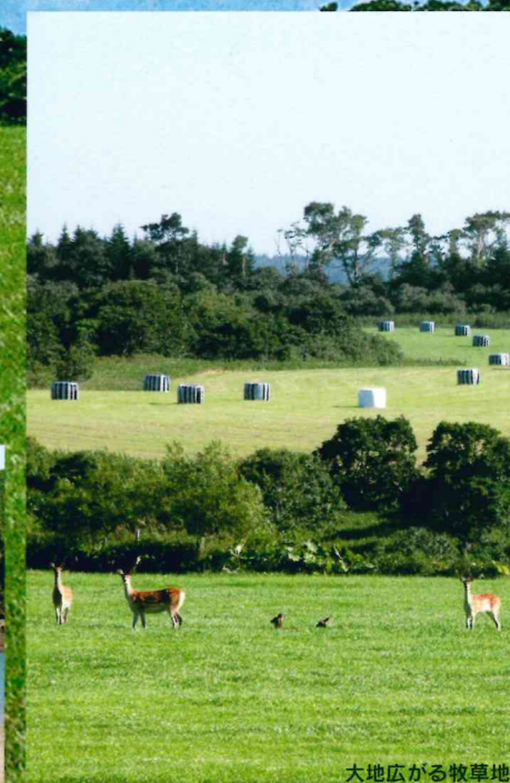
大地広がる牧草地