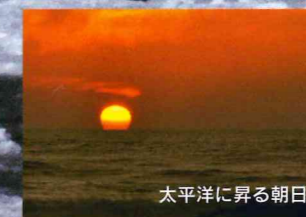
太平洋に昇る朝日

半島に吹く風は、 湖やオホーツクの海を凍らせ氷の世界を作りあげます。 波に漂う沿岸氷は、遥かな旅を経た流氷の到来を告げるように港を埋め、 来春の漁への期待を高めます。