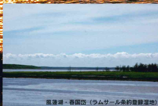
風蓮湖・春国岱(ラムサール条約登録湿地)