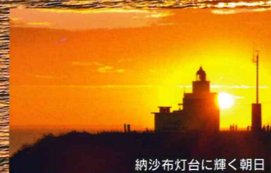
納沙布灯台に輝く朝日