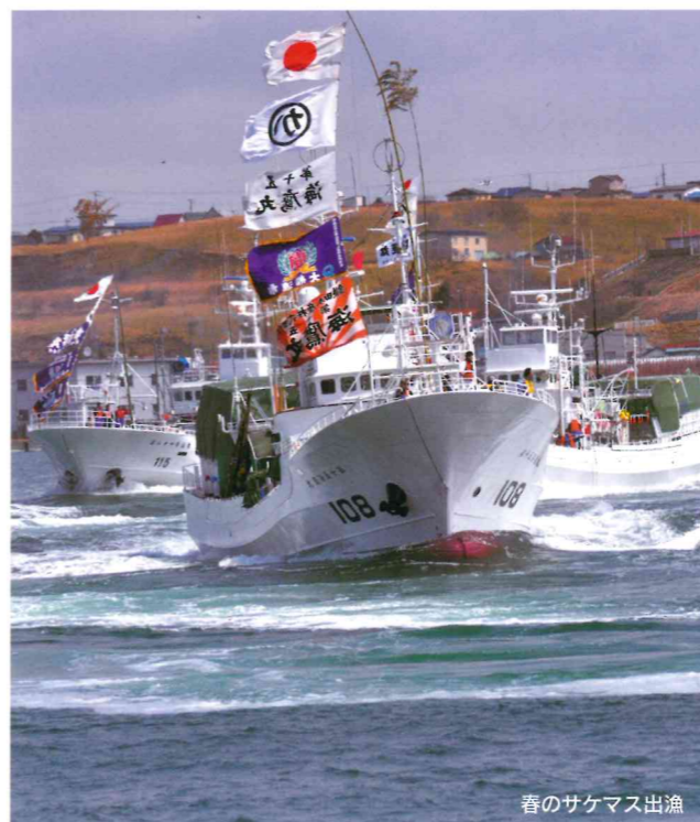
春のサケマス出漁