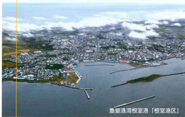
重要港湾根室港「根室港区」