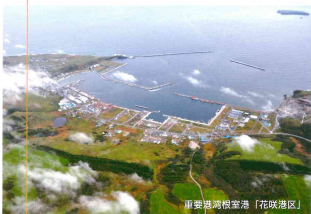
重要港湾根室港「花咲港区」