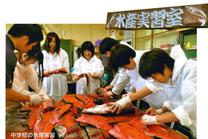
中学校の水産実習