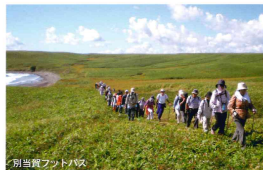
別当賀フットパス

明日の農業を担う後継者の育成・確保や環境にやさしく安全・安心な農畜産物の安定供給などの経営や生産面をはじめ、地域資源を活用し、農業・商業・観光との連携強化への取り組みや、異業種交流を通じた農業分野のすそ野拡大など、地域経済の活性化につながる新たな取り組みが進められています。