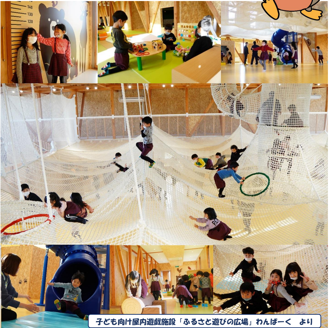
子ども向け屋内遊戯施設「ふるさと遊びの広場」わんぱーく より