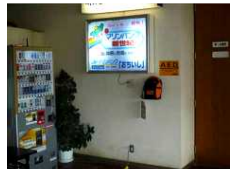
組合内に設置されたAED

今回設置しましたAEDは、空港など公共の場に配備されているAEDと同様の物で、音声ガイダンスによって、一般の人でも使えるように設計されています。操作はいたって簡単で、AEDの発する指示音声にしたがってボタンを押すなどの操作のみで、医療知識や複雑な操作は必要ありません。AEDはカバーを開けると音声ガイダンスが自動で流れます。使用する場合は、落ち着いて音声ガイダンスに従って操作してください。尚、電気ショックが必要かどうかAEDが自動で判断してくれます。