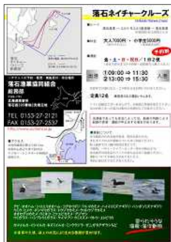
パンフレット(左が表面、右が裏面)