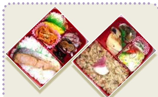
「焼き魚定食」(左)と「炊き込みご飯定食」(右)

4月8日は「ミックスフライ定食」、15日は「焼き魚定食」、22日は「炊き込みご飯定食」が味噌汁と小鉢つきで500円で提供されました。現段階では週1回のペースですが、今後は毎日提供できるようになって、多くの方達に利用されるようになればと思います。尚、定食メニュー以外に「ビーフ彼〜」も700円で提供されています。