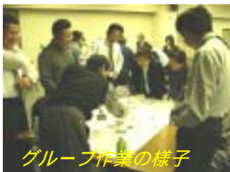
グループ作業の様子

北海道開発局が手がける漁港漁村振興の施策として掲げている『北海道マリンビジョン21』の実現に向けて、各地が主体的に地域の独自性や特色をいかした水産業を核とした地域振興ビジョンを検討し、ビジョンの実現に向けて具体的な取り組み方を策定するものです。ビジョンを策定した地域には地域振興や漁港の整備などで国の支援が得られるメリットがあります。