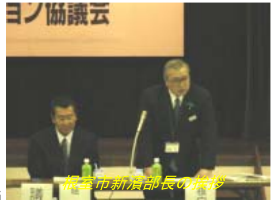
根室市新濱部長の挨拶