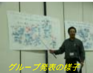
グループ発表の様子