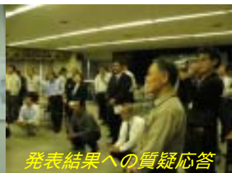
発表結果への質疑応答