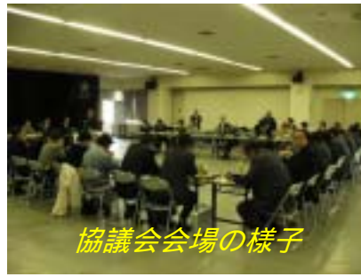
協議会会場の様子