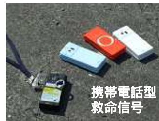
携帯電話型救命信号