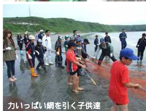
力いっぱい網を引く子供達