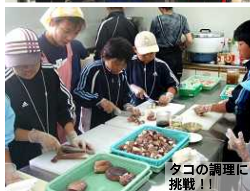
タコの調理に挑戦！！