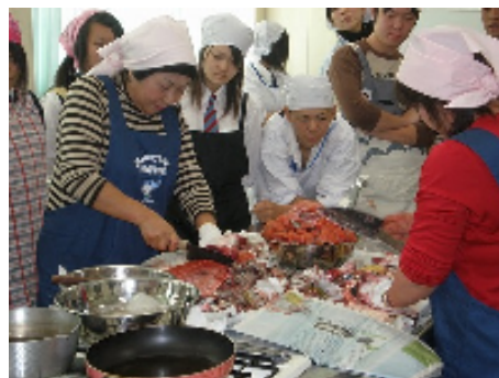
これで「あら汁」を作るんだね。