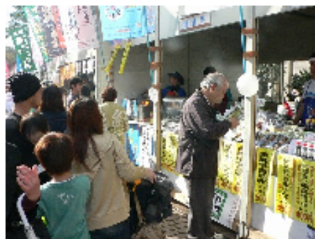
ここが歯舞のブースか?