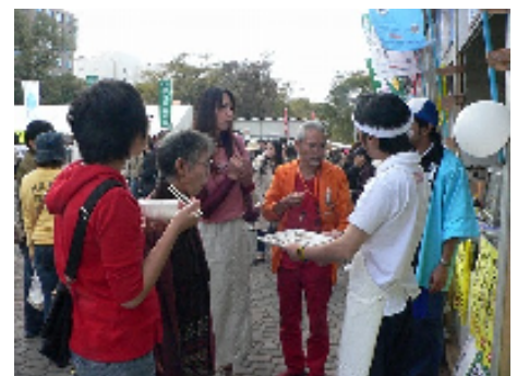
早煮昆布いかがですか。