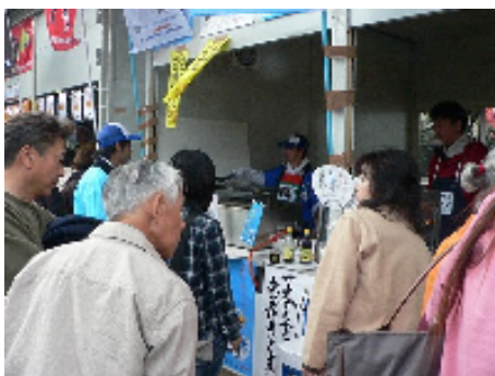
これが「一本立ち」か?

600尾用意した「一本立ち歯舞さんま」は、焼きあがるのを待つ人で行列ができるほど大人気。「昆布しょうゆ」も完売。また、貝殻島の早煮昆布を試食した人は、必ず買うほど大好評でした。歯舞漁協の販売ブースを探してくる人もいて、歯舞の応援団が増えていると感じられました。