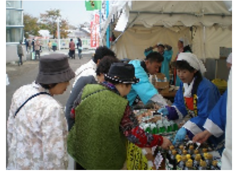
早煮昆布ください