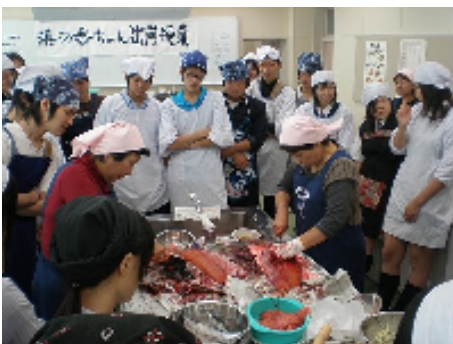
秋さけの「三枚おろし」に真剣に見入る生徒たち

地元の新鮮な魚介類を使った調理実習を通じた魚食普及、水産業への理解を深める「浜の母さん出前料理教室」は、歯舞地区マリンビジョン協議会の活動として、今後とも女性部が積極的に取り組んでいきます。