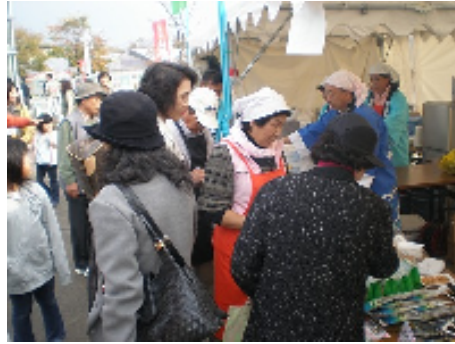
大勢の人が集まってきた！

初日は午前中の雨、2日目は強風など天候に悩まされましたが、昆布佃煮100パックは午前中に完売、一本立ち歯舞さんま600尾、秋さけ山漬け40尾、北海しまえび500g入り10パック、昆布かりんとう70袋も完売するほど大盛況でした。北見での出展は初めての試みでしたが、「今年初めてだね」、「大きくて生きの良いサンマだね」、「刀汁って美味しいね」、「佃煮の味付けが抜群」などの声がかかって、大いに手ごたえが感じられました。