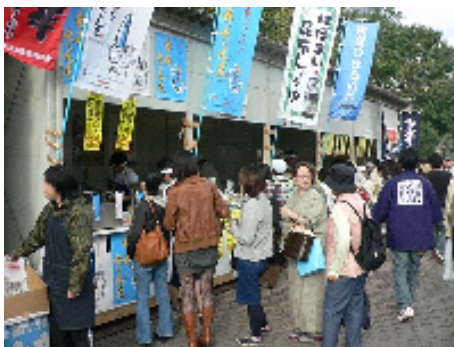
焼きさんまに行列ができちゃった!

全道から特産品など食材を集めて開催された「さっぽろオータムフェスト2008」に、歯舞漁協と女性部が出展。札幌大通り公園の「札幌大通りふるさと市場」会場で9月27~28日、一本立ち歯舞さんま、昆布しょうゆ、昆布八方、昆布かりんとう、早煮昆布など、歯舞水産物をPR販売。