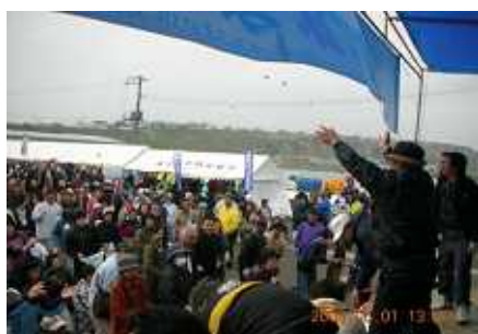
昨年の「おちいし味まつり」

4月17日、「第1回マリンビジョン協議会」「第1回おちいし・味まつり実行委員会」の合同会議を開催しました。協議会では、平成21年度の取組みを決め、昨年度大盛況だった「落石地区浜松フットパス」を6月27日に開催することになりました。開催に合わせて、フットパスコースの整備や準備に励んでいます。