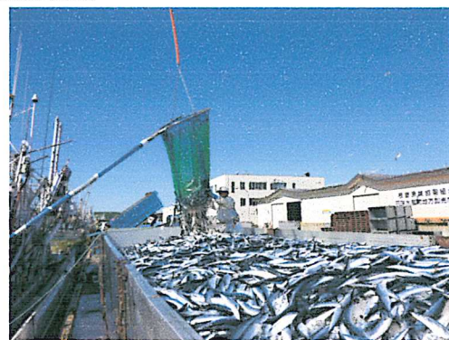
【日本一の水揚げを誇るさんま漁】