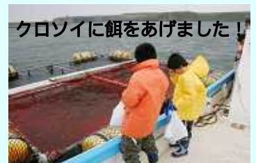
クロソイに餌をあげました！

この取り組みが成功して、落石が少しでも今以上に活気ある町になったらいいなあと思います。今回このような体験が出来て、良かったと思いました。また行きたいです。