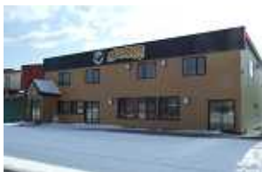
完成した「エトピリ館」

落石地区に建設を進めてきた女性部等の活動拠点「エトピリ館」が完成しました。「エトピリ館」という名前は、ユルリ、モユルリ島に棲息している海鳥のエトピリカにちなんでつけられました。今年の4月から本格的に使用される予定です。厨房室、食品加工室、研修室などがあり、女性部、青年部の各漁業部会の会合、研修、地域住民への開放、女性起業化グループ海鮮工房霧娘などによる多目的な利用を予定しています。皆さんで有効に活用しましょう。