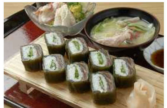
新ご当地グルメ「根室さんまロール寿司」

平成21年2月3日、節分の日恵方巻きを食べる習慣にあわせて、「根室さんまロール寿司恵方巻きを食べよう！」キャンペーンが実施されました。市内7店舗で合計277本の売上がありました。