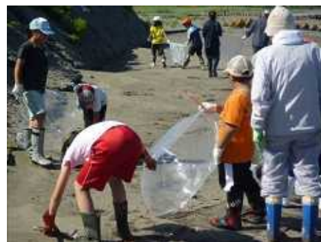
ゴミ拾いをする子供たち