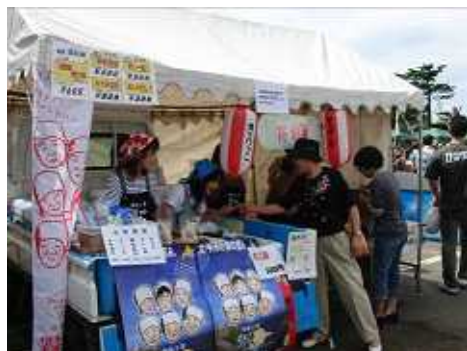
霧娘が出展 売れ行きも好調でした