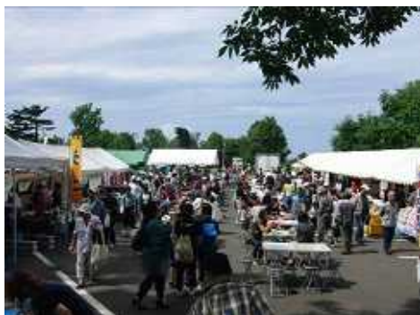
大勢の人が集まりました

8月22日(日)に根室市内のときわ台公園で根室青年会議所を中心とする実行委員会の主催で、軽トラねむろ名産市が晴天の中開かれ、海鮮工房霧娘が出展しました。当日は、北方領土ノサップ岬マラソンも開催され、マラソン参加者に利用してもらおうということからときわ台公園で実施され、落石産のタコを使った「タコ飯」などの加工品が飛ぶように売れました。マラソン参加者からは、「去年はマラソンの後、何もすることがなかったのでこういうイベントがあるといいですね」と話していました。