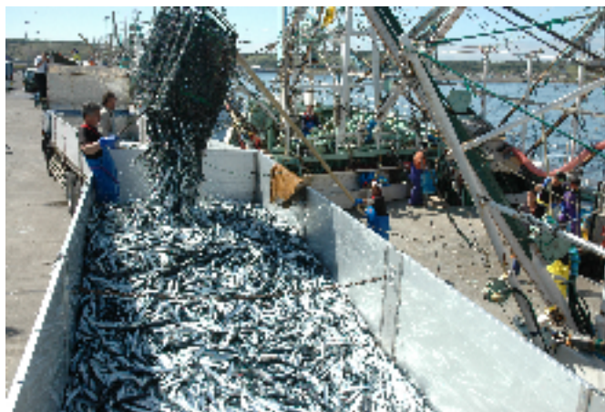
■9月に最盛期を迎える「さんま漁」